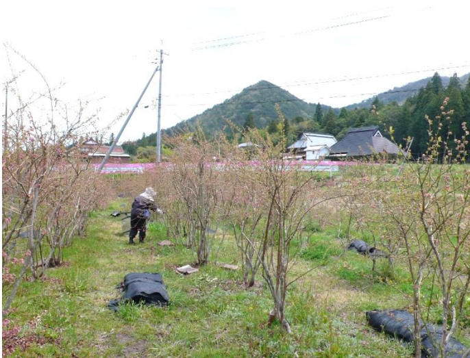
② 2段目のブルーベリー畑の剪定を続ける。