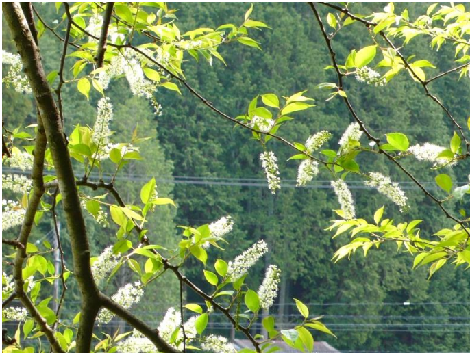
② 白くて長い花穂が春光に浮かぶ。