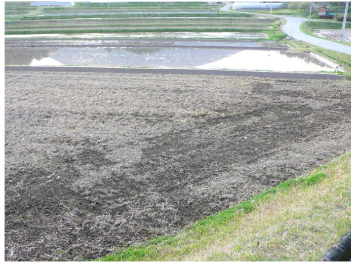
② 農園の周辺の田んぼは田植えに備えてもう水が張られている所もある。